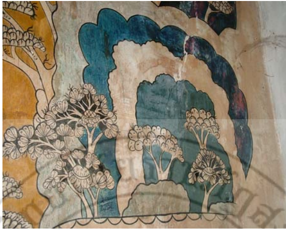
ภาพที่ 20 ภาพจิตรกรรมฝาผนังวัดจະทังพระ (ภาพ โขดหินและต้นไม้)