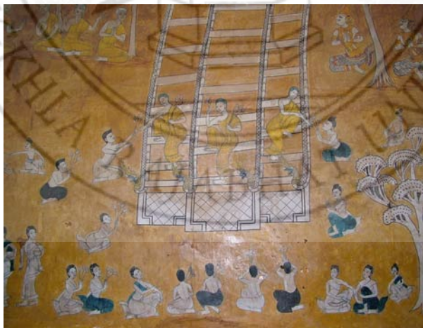
ภาพที่ 23 ภาพจิตรกรรมฝาผนังวัดจระกิ้งพระ แสดงวิถีชีวิตของคนไทยที่สอดคล้องกับพระพุทธศาสนา (โลกมนุษย์)