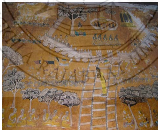
ภาพที่ 21 ภาพจิตรกรรมฝาผนังวัดจະทังพระ ตอนเสด็จโปรด พุทธมารดา (บนสุด) และเสด็จกลับจากสวรรค์ชั้นดาวดึงส์(กลาง)