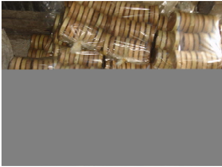
ภาพที่ 15 แสดงการใส่ถุงพลาสติกและยางรัดปากถุง