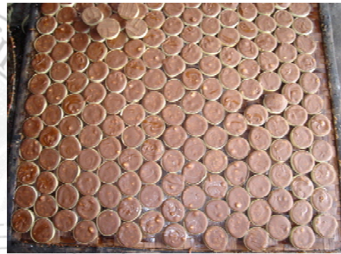
ภาพที่ 12 แสดงน้ำตาลแว่นที่อยู่ในกระดิ่งสี่เหลี่ยม