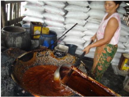
ภาพที่ 9 แสดงการลำเลียงน้ำตาลแว่นที่เคี่ยวเสร็จ