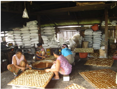
ภาพที่ 11 แสดงการหยอดน้ำผึ้งลงแว่นเป็นน้ำตาลแว่น