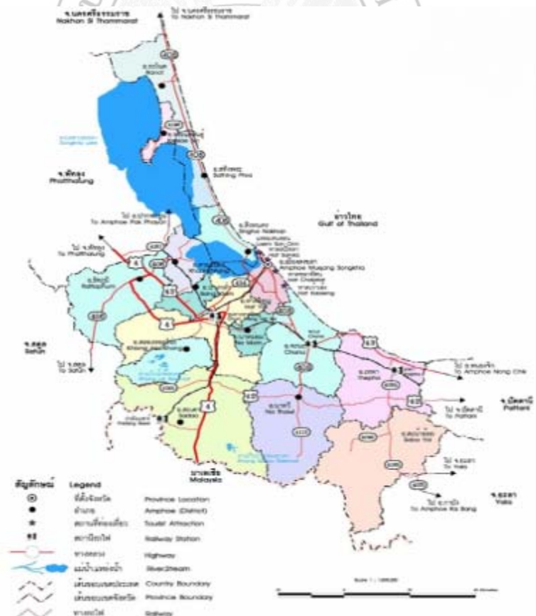
ภาพที่ 1 ภาพแผนที่จังหวัดสงขลา

การศึกษาวิจัยเรื่อง การศึกษาเงื่อนไขการเกิดความเข้มแข็งของกลุ่มอาชีพน้ำตาลแว่น ตำบลท่าบ อำเภอสิงหนคร จังหวัดสงขลานั้น ผู้วิจัยจะต้องทราบสภาพพื้นที่โดยทั่วไป รวมทั้งวิถีชีวิตของชุมชนตำบลท่าบก่อนเพื่อเป็นแนวทางในการลงไปศึกษาวิจัยหาผลการวิเคราะห์ข้อมูลสรุปผล อภิปรายผล ข้อเสนอแนะ ที่เกี่ยวกับเงื่อนไขการเกิดความเข้มแข็งของกลุ่มอาชีพน้ำตาลแว่น ตำบลท่าบ ในการทำงานวิจัยครั้งนี้ ผู้วิจัยได้ศึกษาเกี่ยวกับบริบทชุมชนท่าบ และกลุ่มอาชีพน้ำตาลแว่นตำบลท่าบ ในลักษณะดังต่อไปนี้