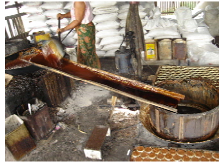
ภาพที่ 10 แสดงน้ำตาลแว่นที่มาพักในหม้อพักใหญ่รอแห้ง