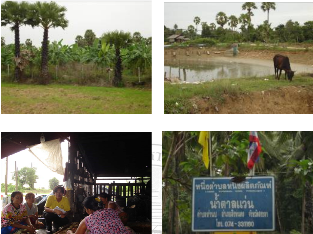
ภาพที่ 20 แสดงบริบททั่วไปของกลุ่มอาชีพน้ำตาด่วนตำบลท่านบ

ผู้วิจัยได้แยกบริบทของสมาชิกในกลุ่มอาชีพน้ำตาด่วนตำบลท่านบไว้เป็นประเด็นเพื่อให้เข้าใจง่ายดังนี้