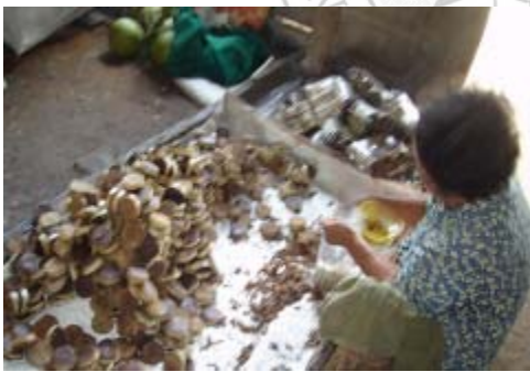
ภาพที่ 13 แสดงการบรรจุลงถุงแล้วเตรียมชั่งปริมาณ