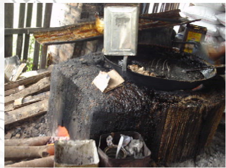
ภาพที่ 5 แสดงการเตรียมแวนและวัสดุการทำน้ำตาลแว่น ภาพที่ 6 แสดงการเตรียมอุปกรณ์ทำน้ำตาลแว่น