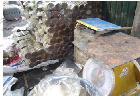
ภาพที่ 14 แสดงเครื่องชั่งน้ำตาลแว่น สมุดคุมน้ำหนัก