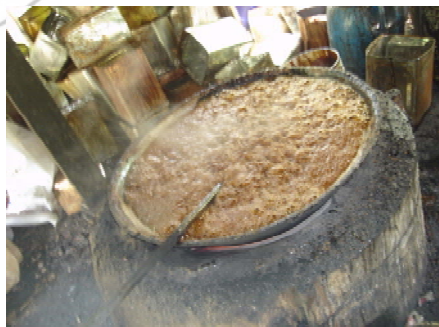
ภาพที่ 7 แสดงการนำส่วนผสมลงกระทะเพื่อผลิต ภาพที่ 8 แสดงน้ำตาลแว่นที่ผสมเข้ากัน เคี้ยวจนเหนียว