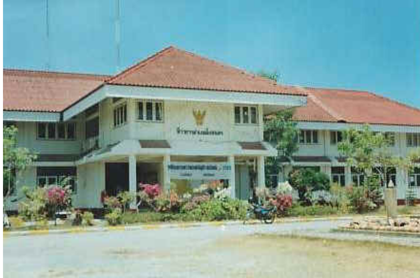
ภาพที่ 2 ภาพอำเภอสิงหนคร