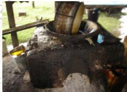
ภาพที่ 18 แสดงเก็บล้างทำความสะอาดอุปกรณ์การผลิต

สรุปผลการศึกษาวิจัยพบว่า ในขั้นตอนการผลิตที่สำคัญคือ การที่สมาชิกทุกคนมีส่วนร่วมกันดำเนินกิจกรรมของกลุ่มอาชีพน้ำตาลแว่นตำบลทำนบ และกลุ่มมีสูตรในส่วนผสมที่ลงตัวทำให้มีรสชาติอร่อย น่ารักประทาน ลูกค้าประทับใจเป็นที่ต้องการของลูกค้า สูตรการผสมในการทำน้ำตาลแว่นเป็นความลับของกลุ่มที่ไม่บอกใครแต่มาศึกษาได้