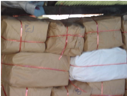
ภาพที่ 17 แสดงการบรรจุภัณฑ์ที่สมบูรณ์เก็บไว้สต็อก