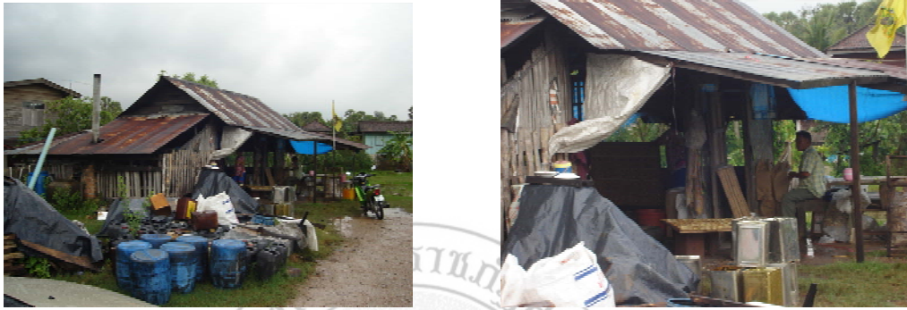
ภาพที่ 19 แสดงโรงเรือนของกลุ่มอาชีพน้ำตาลแว่นตำบลทำนบ

ง. สถานที่ทำการผลิต ได้ใช้สถานที่ทำการผลิตเป็น โรงเรือนทำน้ำตาลแว่นของ ปรชชนกลุ่มมาตั้งแต่เริ่มทำกลุ่มกัน ในโรงเรือนภายในจะมีหลังคากันฝน และไม่มีปัญหา ในเรื่องฝุ่นละออง ซึ่งลักษณะโรงเรือนดังจะแสดงภาพดังนี้