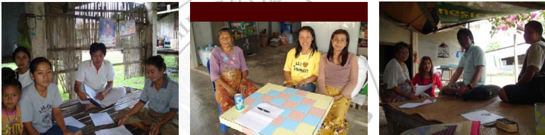
ภาพที่ 22 แสดงการสัมภาษณ์แบบสนทนากลุ่มของกลุ่มอาชีพน้ำตาลแว่นตำบลท่านบ

หรือแล้วแต่โอกาสจะเอื้ออำนวยต่อการพบปะพูดคุยกัน หรือตามสถานการณ์ของสมาชิกกลุ่มอาชีพ น้ำตาลแว่นตำบลท่านบ เพื่อเก็บรวบรวมข้อมูลการศึกษาวิจัยได้ตลอดเวลาลงพื้นที่ และรวมตลอด ถึงการวิเคราะห์ข้อมูลได้ถูกต้องตามความข้อมูลที่ได้มา การสนทนากลุ่มนี้ได้เรียนรู้แง่มุม ของคนภายในกลุ่มอาจมีความคิดเดียวกันหรือขัดแย้งโต้ตอบกันบ้าง เกิดความรู้สึกร่วมรับรู้ร่วมกับ ประเด็นปัญหาหรือข้อสรุปกันในกลุ่ม ในระหว่างการสัมภาษณ์เป็นกลุ่มนี้ ผู้ศึกษาวิจัยสอดแทรก การพูดคุยให้สนุกสนานบ้าง เพื่อเป็นการทำให้การสัมภาษณ์ไม่น่าเบื่อ และทำให้เวลาเดินไปอย่าง รวดเร็ว แต่เนื้อหาข้อมูลที่ต้องการได้ครบถ้วนตามประเด็นปัญหาที่เตรียมและที่ต้องการไป สัมภาษณ์ในแต่ละครั้งนั้นด้วย ประเด็นการสัมภาษณ์มีดังนี้