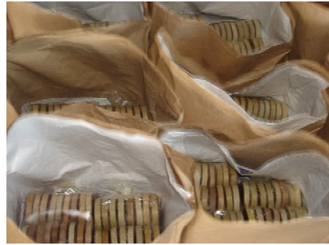
ภาพที่ 16 แสดงการบรรจุลงในกระดวยสีน้ำตาล