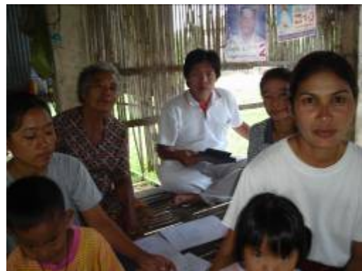
ภาพที่ 21 แสดงการมีส่วนร่วมกันของสมาชิกทุกคน ในการดำเนินกิจกรรมทำน้ำตาลแวน และการสัมภาษณ์ร่วมกันเป็นกลุ่มของกลุ่มอาชีพน้ำตาลแวนตำบลท่าบอง