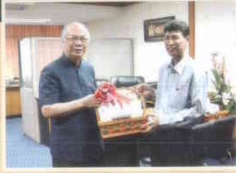
๒. คณะเทคโนโลยีการเกษตร