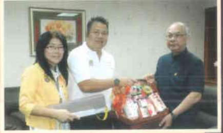
๙. ธนาคารกรุงศรีอยุธยา