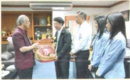
๘. ธนาคารกรุงไทย