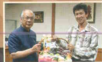
๒๓. หจก.เอส.พี.โยธากิจ (๑๙๘๘)