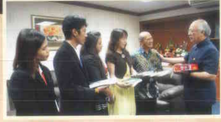
๓. บัณฑิตวิทยาลัย