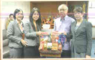
๑๑. ธนาคารธนชาติ