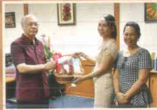
๑๙. โรงแรมราชवंชคลาส พาวริสเลียนฯ