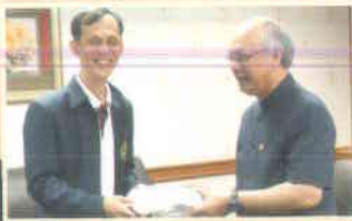
๑๐. ธนาคารซีไอเอ็มบีไทย