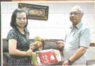
๑๘. โรงแรมกรีนเวสต์ สงขลา