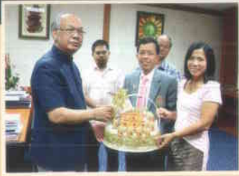
๑. คณะมนุษยศาสตร์ฯ