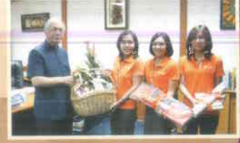
๑๓. ธนาคารอาคารสงเคราะห์