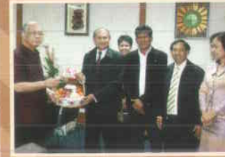
๒๐. สำนักงานศึกษาธิการภาค ๑๑