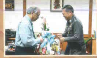
๑๗. ผู้บัญชาการภาค ๙