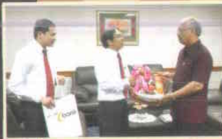
๑๔. ธนาคารอิสลาม