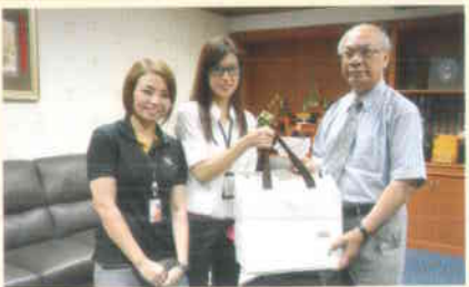
๗. บจก.ทรูคอร์ปอเรชั่น