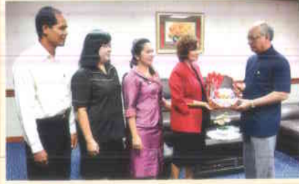
๕. สถาบันวิจัยและพัฒนา