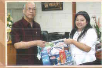
๒๑. หจก.หาดใหญ่สุวรรณพิกังก่อสร้าง