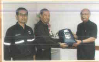
๑๕. บริษัทเซฟรอนฯ