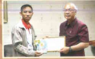
๑๖. ชมรมพระพุทธ