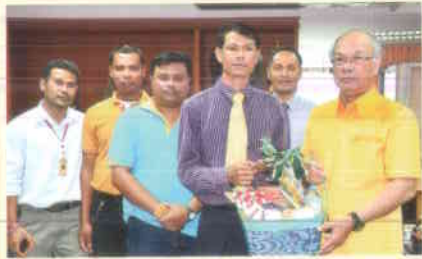
๔. สำนักวิทยบริการฯ