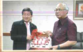
๑๒. ธนาคารอมลีน