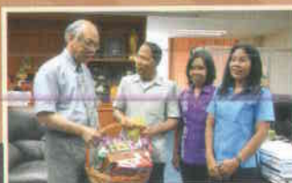
๒๒. อบจ.สงขลา