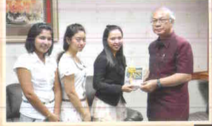
๖. บ้านสาธิตปทุมวัน