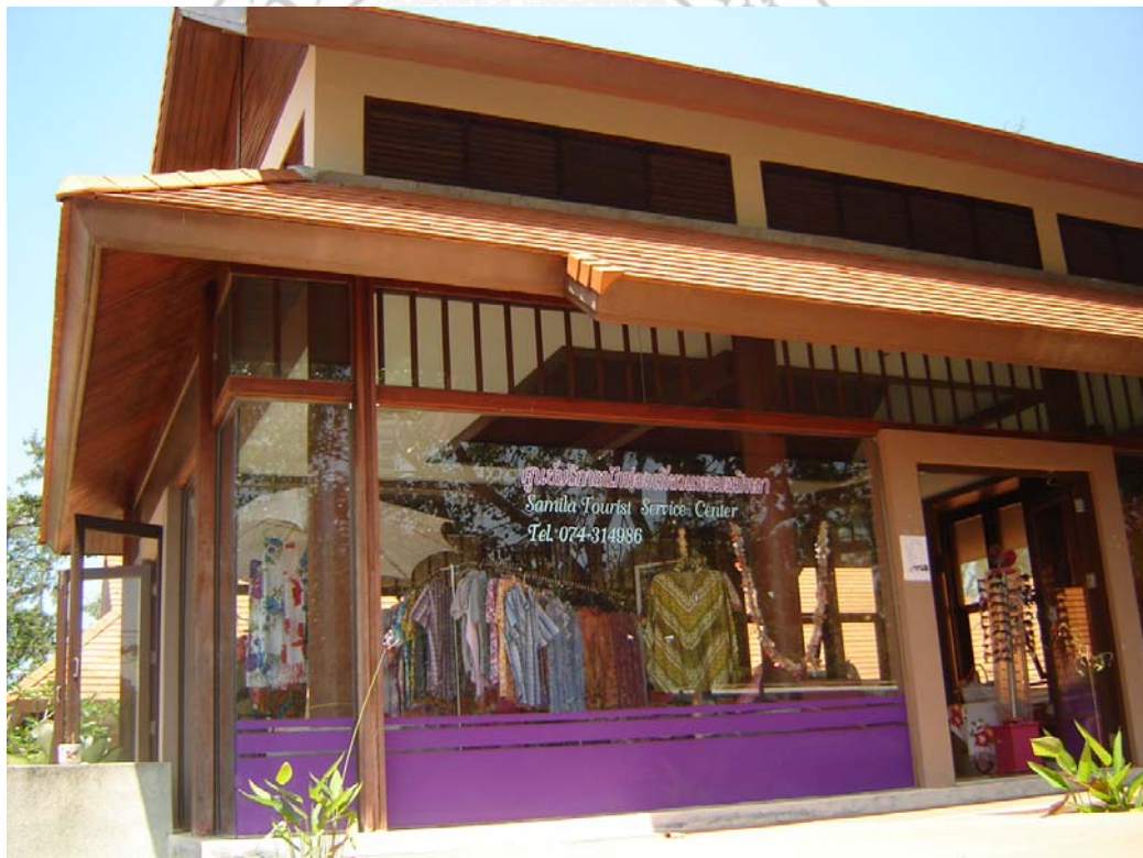
ภาพ 12 ศูนย์บริการนักท่องเที่ยวแหลมสมิหลา

และนอกจากนี้ ด้วยความร่วมมือของเทศบาลนครสงขลาได้ทำการจัดตั้งศูนย์บริการนักท่องเที่ยวไว้ที่ หาดสมิหลา ซึ่ง ณ จุดนี้เองเมื่อมีการจัดตั้งบริการนักท่องเที่ยวแล้วยังมีการจัดตั้งร้านจำหน่ายของที่ระลึก และแน่นอนว่า ของที่ระลึกที่ต้องคิดไม่ติดมีนักท่องเที่ยวกลับไป หนึ่งในนั้นก็ต้องมี ผลิตภัณฑ์ผ้าทอเกาะยออยู่ด้วย