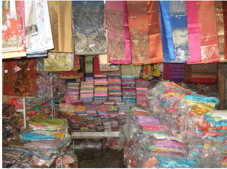
ภาพ 9 สภาพภายในร้าน