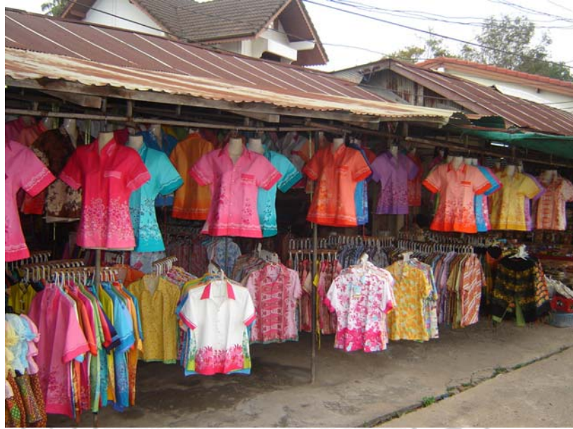
ภาพที่ 8 บริเวณหน้าร้านที่มีการจำหน่ายเสื้อผ้า batik สำเร็จรูป

“...หน้าร้านแบบนี้เรียกลูกค้าได้คือนะแบบว่ามันสีสันดี พอลูกค้ามาเค้าก็ถามว่าผ้าเกาะยอเป็นแบบไหน เราก็พาเข้าไปดูว่าเนี่ย ผ้าทอเกาะยอ ส่วนที่แขวนอยู่หรืออื่นๆ ไม่ได้เป็นผ้าทอเกาะยอ แต่บางตัวเราก็สั่งให้เค้าทำก็ต้องขายเฉลี่ยๆ กันไป ถ้าขายเฉพาะผ้าเกาะยอคงลำบาก...”