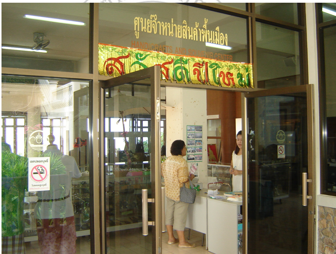
ภาพ 11 ศูนย์จำหน่ายสินค้าพื้นเมือง สถาบันทักษิณคดีศึกษา

นอกจากร้านค้าและกลุ่มทอผ้าที่มีการจัดจำหน่ายผลิตภัณฑ์ผ้าทอเกาะยอกันอยู่แล้ว บริเวณสถานที่ท่องเที่ยวต่างๆ ก็ได้มีการจัดหาผลิตภัณฑ์ผ้าทอเกาะยอไปวางจำหน่ายด้วยเช่นกัน อาทิเช่น สถาบันทักษิณคดีศึกษา พิพิธภัณฑ์คดชนวิทยา ซึ่งตั้งอยู่ที่ตำบลเกาะยอเอง สถานที่นี้ จะมีนักท่องเที่ยว กลุ่มนักเรียนนักศึกษา จากสถาบันการศึกษาและหน่วยงานต่างๆ มาเข้าชมกันไม่ขาดสายตลอดปีและที่สถาบันทักษิณคดีศึกษาเองยัง ได้จัดพื้นที่เพื่อเป็นศูนย์จำหน่ายสินค้าพื้นเมืองไว้บริการกลุ่มนักท่องเที่ยว