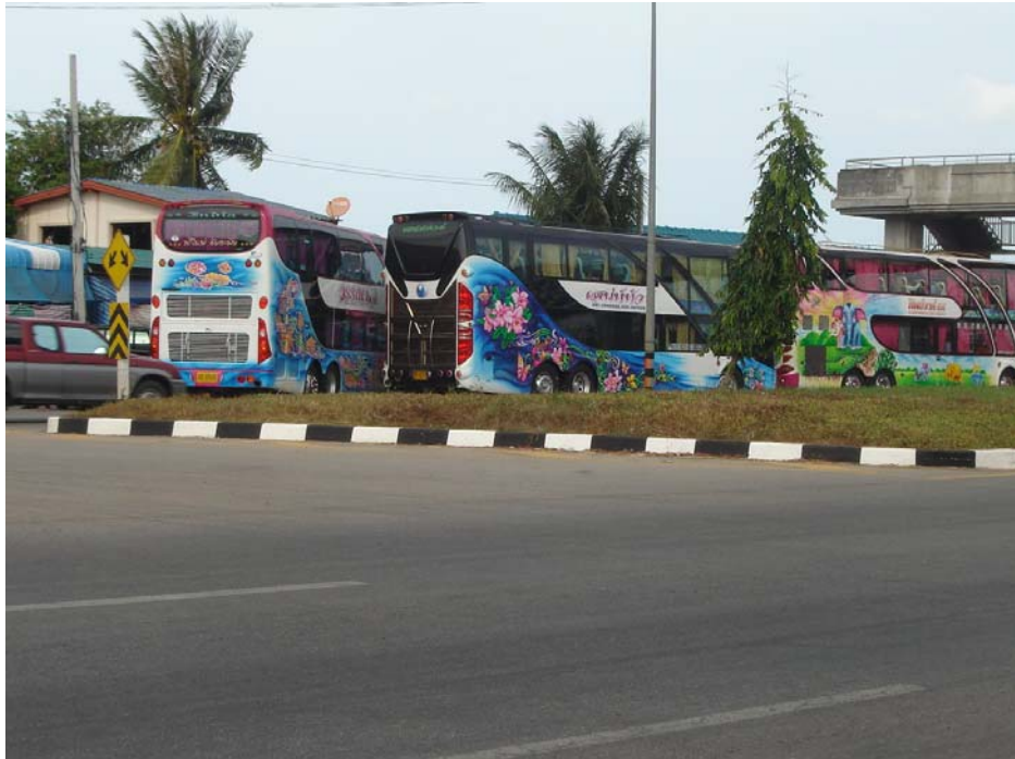
ภาพ 7 อีกด้านหนึ่งของตลาดเกาะข่อยที่รถทัวร์ท่องเที่ยวแวะมา ในวันหยุด

ทั้งสองฝั่งของตลาดเกาะข่อย จะเต็มไปด้วยร้านค้าที่มีการจัดจำหน่ายผลิตภัณฑ์ผ้าทอเกาะข่อย และผลิตภัณฑ์ท้องถิ่นอื่นๆ มากมาย ในร้านค้าต่างๆ นอกจากจะมีการจำหน่ายผลิตภัณฑ์ผ้าทอเกาะข่อย เพียงอย่างเดียว ยังมีการจำหน่ายผลิตภัณฑ์ผ้าบาติก ผ้าปาเต๊ะ และอื่นๆ อีก จากคำบอกเล่าของเจ้าของร้านรายหนึ่งกล่าวว่า