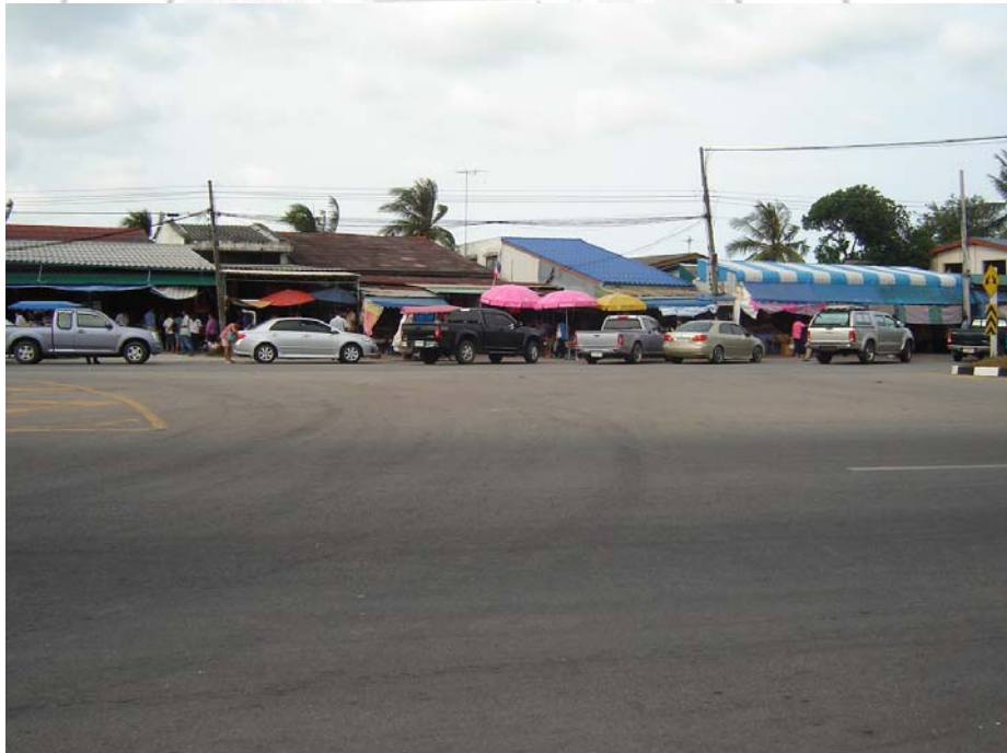
ภาพ 6 สภาพรถนักท่องเที่ยวที่แวะเวียนมาเลือกชมสินค้า ณ ตลาดเกาะยอ

3.1.2 ร้านค้าจัดจำหน่าย ณ ตลาดเกาะยอ ซึ่งในปัจจุบันมีร้านค้าที่ทำการจัดจำหน่ายผลิตภัณฑ์ผ้าทอเกาะยออยู่มากมายหลากหลาย ตลอดสองฟากฝั่งของถนน ซึ่งเป็นจุดที่นักท่องเที่ยวมาจอดรถแวะพัก เพื่อชมทัศนียภาพและหาซื้อของฝากของขวัญกัน ได้สะดวก