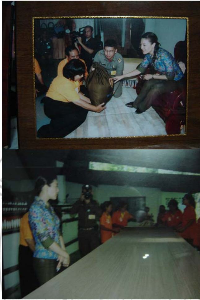
ภาพ 5 พระเจ้าวรวงศ์เธอ พระองค์เจ้าศรีรัศมิ์ พระวรชายาในสมเด็จพระบรมโอรสาธิราช เจ้าฟ้ามหาวชิราลงกรณ สยามมกุฎราชกุมาร เสด็จมาเยี่ยมชม ณ ที่ทำการกลุ่มแม่บ้านเกษตรกร ทอผ้าเกาะยอ เมื่อปี พ.ศ. 2552