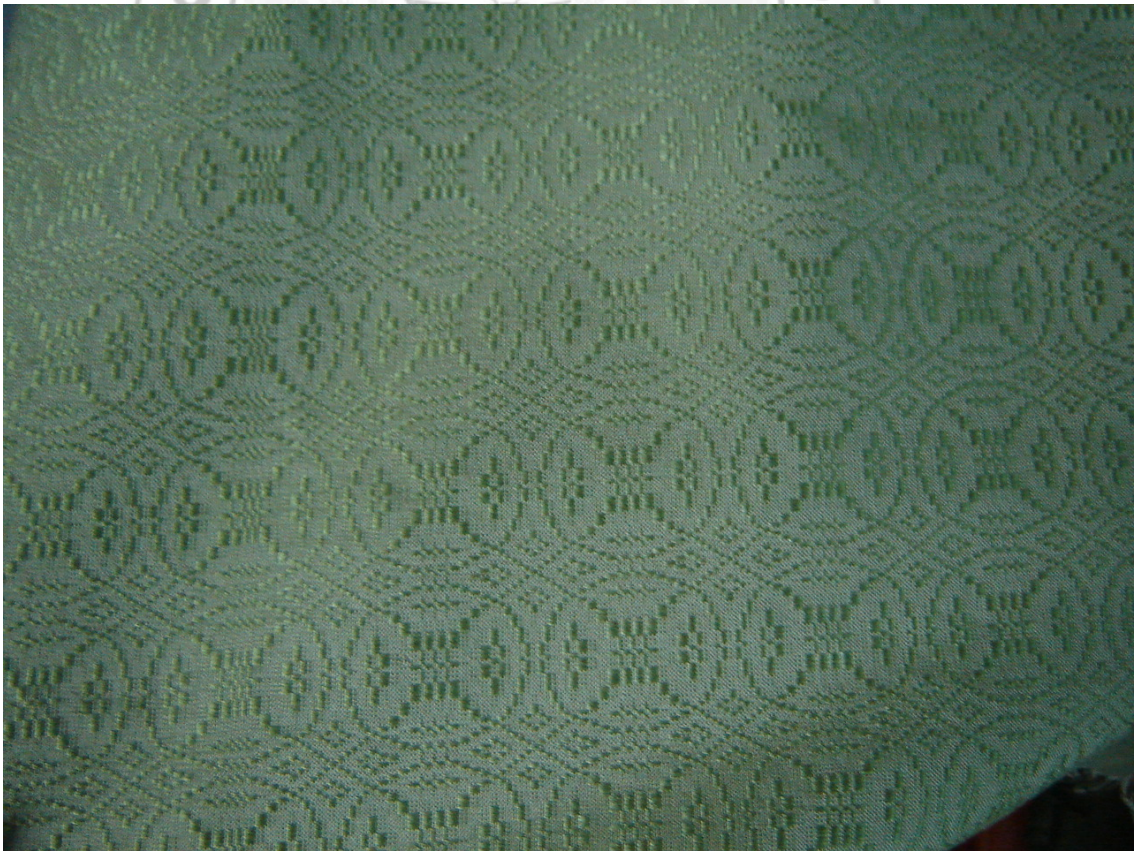
ภาพ 3 ลายผ้าขอมประกาย ของกลุ่มแม่บ้านเกษตรกรทอผ้าเกาะขอม

(สมหมาย พงศ์พฤกษ์, สัมภาษณ์, 5 มกราคม 2554)