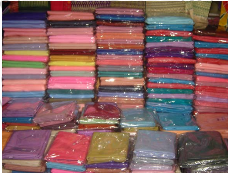
ภาพ 10 กองผ้าทอเกาะยอที่สีสันต่างๆเรียงรายกันอยู่

“...ลูกค้าเดินเข้าร้านมาก็จะเห็นผ้าที่กองๆ กั้นอยู่ตรงนี้เลยตอนนี้ลูกสาวมาช่วยขายด้วยก็ค่อยๆ ปรับพัฒนาไป กลางๆ ปีนี้ก็จะพักร้านแล้วก็ปรับปรุงร้านใหม่ จะแบ่งเป็น โซนๆ แล้วว่าตรงไหนวางสินค้าอะไร มีพวกผ้า และของแห้งด้วย...”