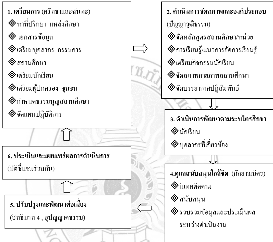
ภาพ 2 ขั้นตอนการบริหารจัดการ โรงเรียนวิถิปุทธ